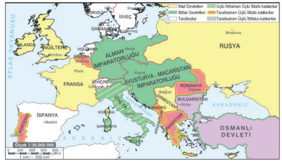
Harita 2.1: Birinci Dünya Savaşı başladığı sırada Avrupa (1914)

Savaşın özel nedenleri arasında şunlar vardır: Rusya ile Avusturya-Macaristan İmparatorluğu, Balkanlara ve Doğu Avrupa'ya egemen olmak için çekişiyordu. Rusya'nın yürüttüğü Panslavizm ile Avusturya-Macaristan İmparatorluğu'nun yürüttüğü Pancerme-nizm politikaları bu topraklar üzerinde Birinci Dünya Savaşı Öncesinde Genel Durum mücadele hâlindeydi. Ayrıca Fransa, 1871'de meydana gelen Sedan Savaşı'nda Almanya'ya kaptırdığı zengin kömür ve demir kaynaklarına sahip Alsace-Lorraine (Alsas-Loren) bölgesini geri almak istiyordu.